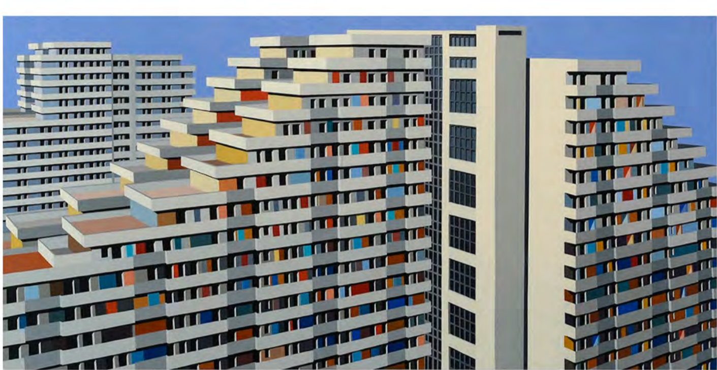
Marco Petrus, M14, 2015, olio su tela, 100x200 cm

Il recente ciclo pittorico intitolato Matrici porta, a Palazzo Zevallos Stigliano, sede museale di Napoli delle Gallerie d'Italia di Intesa Sanpaolo, la riflessione attuale di Marco Petrus (1960), tra i maggiori e più significativi protagonisti della pittura italiana contemporanea.